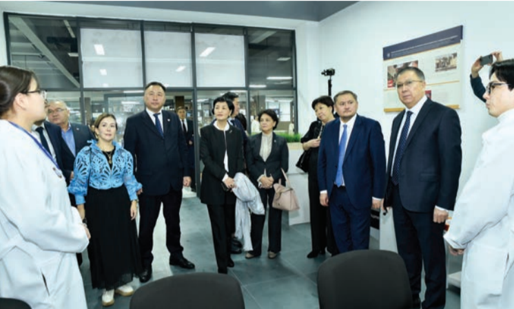
Соңы. Басы 1-бетте

ЖОО басшыларын ҚазҰУ ректоры Жансейіт Түймебаев қарсы алып, жаңадан ашылған зертханаларға экскурсия ұйымдастырылды.